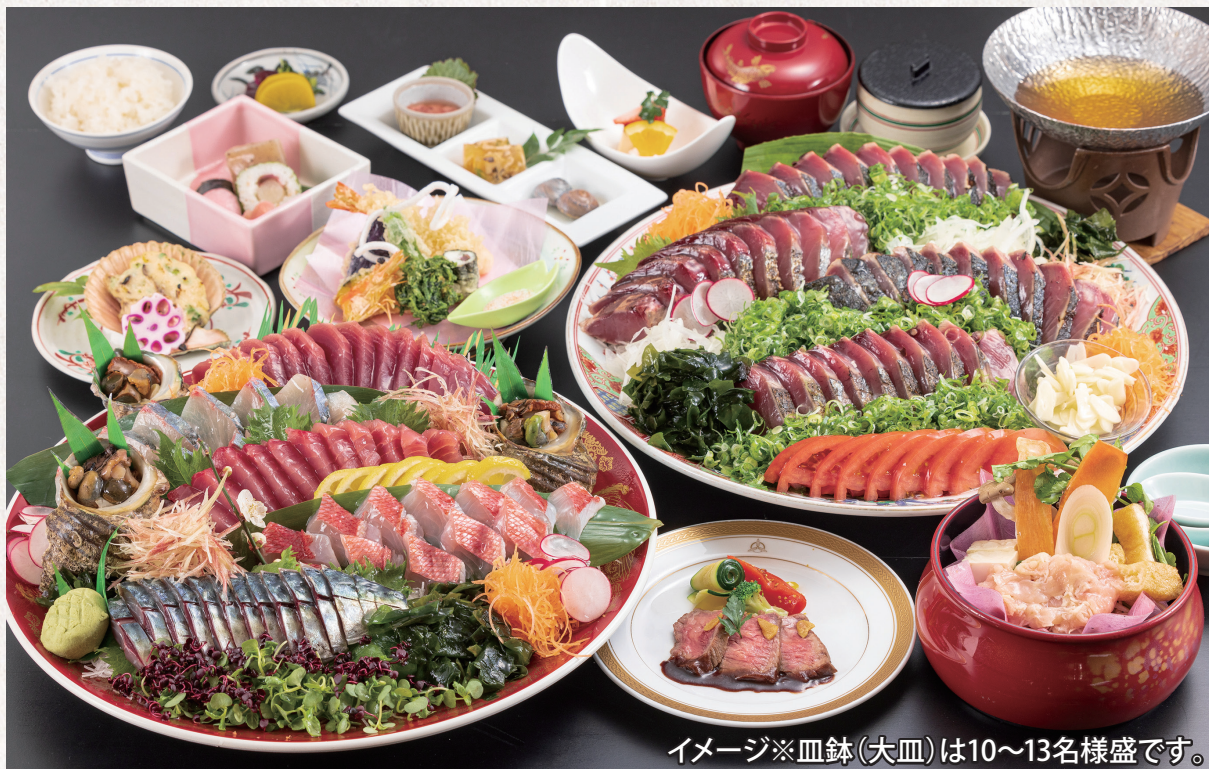
イメージ※皿鉢(大皿)は10～13名様盛です。

高知市内中心部唯一の天然温泉旅館です。壺号館(禁煙棟)は2020年秋オープン、建物全体は2021年秋リニューアルオープン。