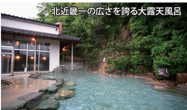
北近畿一の広さを誇る大露天風呂